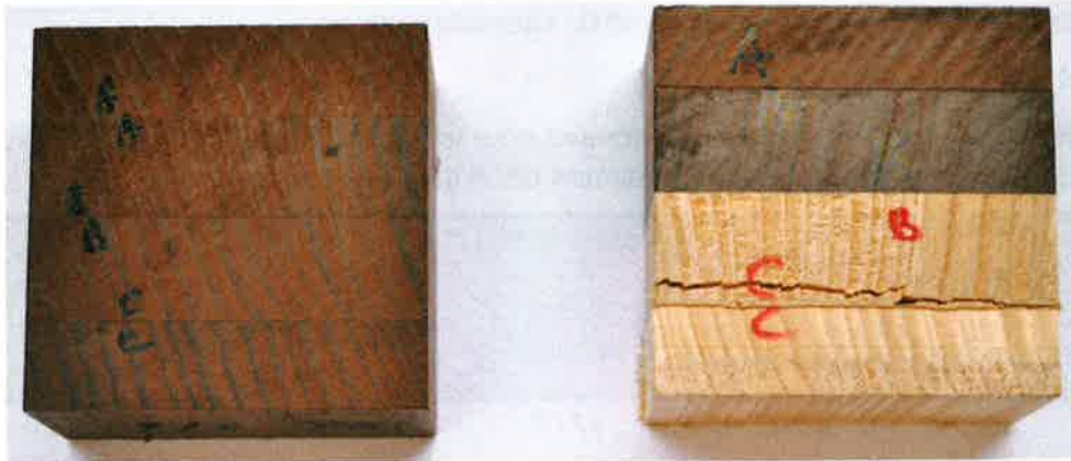
Figure 2. Echantillons sciés pour l'essai