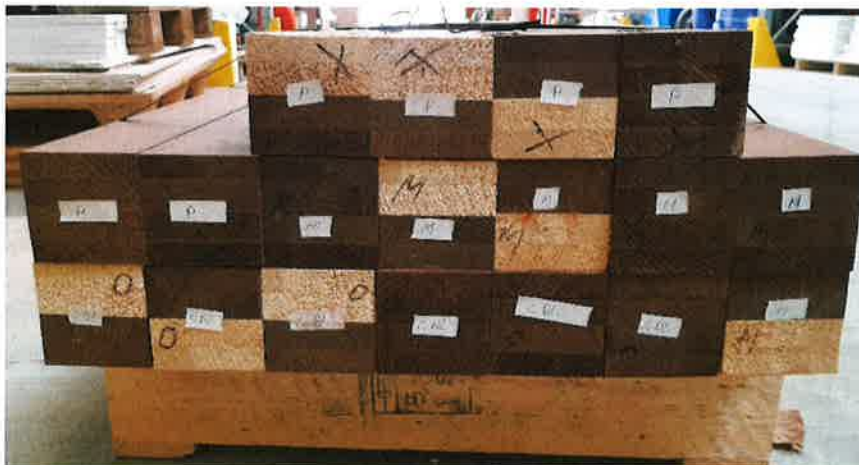
Figure 1. Echantillons fournis